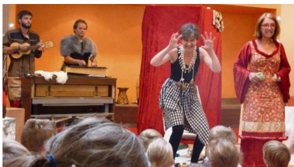
« Zouc et Agla », un spectacle qui a ravi le public